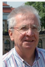
Anschrift des Autors: Klaus Rothenhöfer Scheffelstraße 3 69168 Wiesloch

und an die Heidelberger Straßen- und Bergbahn weiterverpachtet. Der Kaufpreis betrug damals 1,9 Mio. Mark, demgegenüber standen im Jahr 1904 Einnahmen in Höhe von 186 000 Mark, man errechnete sich damals noch ein rentables Geschäft aus dem Betrieb der Straßenbahnlinien. Über die Motive für den damaligen Kauf gibt ein Geschäftsbericht der Heidelberger Straßen- und Bergbahn aus dem Jahr nach dem Erwerb Aufschluss. Dort heißt es, da die Stadtgemeinde Heidelberg durch den Ankauf von mehr als drei Viertel sämtlicher Aktien unseres Unternehmens den ausschlaggebenden Einfluss auf diese gewonnen hat, war es für sie von außerordentlichem Werte, nun auch den Straßenbahnverkehr mit den benachbarten Orten in die Hand zu bekommen. Hierzu war es erforderlich, zunächst die seit 1901 bestehende »Elektrischen Bahn Heidelberg Wiesloch« zu erwerben. Obschon der Bauwert der Anlage erheblich geringer war, entschloss sich die Stadt doch, den von der Besitzerin der Bahn, der Deutschen Eisenbahn-Gesellschaft in Frankfurt a. M. geforderten Kaufpreis von Mk. 1 900 000 zu akzeptieren, nachdem ihr von uns die Rentabilität des Unternehmens auch bei diesem Preise als gesichert bezeichnet wurde, was durch das vorliegende Ergebnis des abgelaufenen halben Geschäftsjahres auch bewiesen ist.