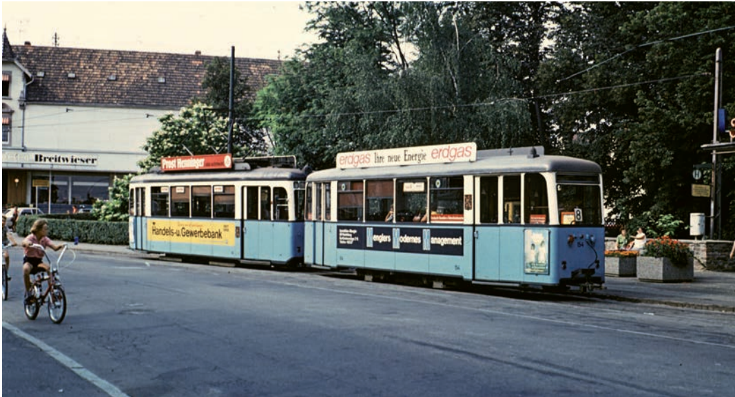
Tw 80 und Bw 154 an der Endstelle in Wiesloch im letzten Betriebsjahr 1973. Der Tw 80 ist noch heute als Museumsfahrzeug im Einsatz

je 20 Sitzplätzen im Innern auf Längssitzen und 14 Stehplätze auf den Plattformen. Die Wagenkästen wurden von der Waggonfabrik H. Fuchs A. G. in Rohrbach gebaut und hatten eine Länge von 8,10 m zwischen den Plattformwänden, eine größte Breite von 2 m und eine Höhe von 3,35 m, von Schienenoberkante gerechnet. Die Strecke über Nußloch bis Wiesloch wurde stündlich, die bis Leimen halbstündlich bedient.