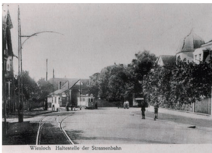
Endhaltestelle Wiesloch in den ersten Betriebsjahren mit Fahrzeugschuppen

Verehrlicher Stadtrath in Wiesloch wolle gefälligst das Einverständnis zu unserer Concessionseingabe beschliessen, uns seine Beihilfe zur Durchführung der elektrischen Bahn von Heidelberg bis Wiesloch zusichern, und uns diesen Beschluss baldmöglichst übersenden.